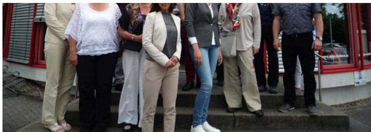
Der JUST zu Besuch bei Mplus

Die Mplus Managementgesellschaft zählt 75 Mitarbeiter, eine Niederlassung in Stuttgart und über 10.000 spannende nationale und internationale Projekte. Ob im betrieblichen Umfeld oder auf Baustellen: über 2.000 Kunden aus Industrie, Handwerk, Handel, Pflege und Baubranche haben bisher von der Mission Mplus profitiert. Die fortwährende Optimierung von Arbeitsbedingungen – die Minimierung von Unfallrisiken und arbeitsbedingten Belastungen – sorgt für Mitarbeitermotivation, störungsfreie Abläufe und ein starkes Image in der Öffentlichkeit.