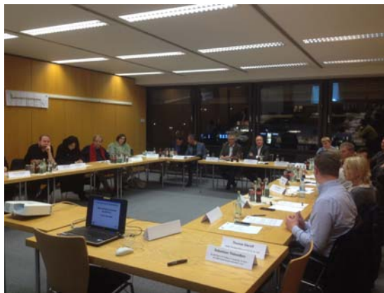
Die Teilnehmer am Gewerbegebietsgespräch in der Diskussion.